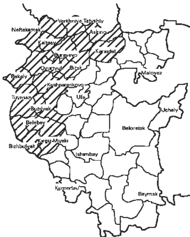
Рис. 2. Карта Башкортостана (штриховкой показаны северо-западные районы)

Чтобы разобраться в закулисных механизмах перемен этничности у башкир и татар, необходимо выяснить, где это явление происходило чаще всего. Анализ статистических данных показывает, что национальная принадлежность населения Башкортостана в целом в XX в. была относительно устойчивой (см. Приложение 1), а изменения этничности происходили главным образом на его северо-западе. Так как рядом проходит граница с Татарстаном, не удивительно, что эти земли являются родными для большинства татар республики (см. Рис. 2). Здесь также проживает много башкир, говорящих по-татарски. Их зафиксировала перепись 1926 г., впервые выделившая национальность и родной язык в отдельные категории. Начиная с этого времени численность и доля татароязычных башкир постоянно сокращалась (см. Таблицу 1). Это ставит перед нами еще ряд вопросов. Откуда взялись татароязычные башкиры? Как они совмещали свое башкирское самосознание с использованием в качестве родного татарского языка, несмотря на все попытки коммунистического режима добиться единства этих признаков? И как они вели себя, когда все же изменяли свою этничность? Начинали ли они считать себя после этого татарами или переходили на башкирский язык, как и положено настоящим башкирам? Наконец, как этот процесс связан с общим ростом численности татар, описанным выше?